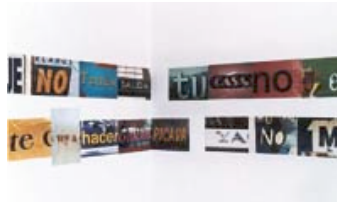
"Víctima serial", instalación de Jorge Macchi (colección Macro).

El nuevo equipo de trabajo, dirigido por el propio Fernando Farina, se propone desarrollar diversas lecturas acerca de la colección, para reforzar y hacer patente la labor de investigación desarrollada a lo largo de dos años. Actualmente, los departamentos de curaduría, investigación, conservación, educación, diseño y merchandising trabajan en proyectos que, de ser posible su concreción, tienden a buscar coherencia con los planteos en tomo de la resolución de la imagen estructural que ha proporcionado la idea de fábrica. Estos proyectos se cruzan en cierta inclinación a considerar que la obra contemporánea puede mostrarse de distintos modos, inclusive expandiendo su sentido hacia afuera de las salas de exposición. Este bosquejo ha sido posible justamente porque las obras con las que cuenta