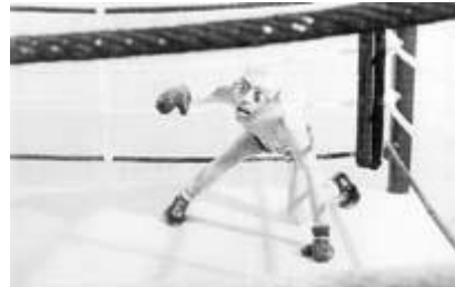
Detalle de "El enemigo invisible", escultura de Pablo Suárez 2001; resina epoxi; 148x110x110 cm.

El nuevo Museo de Arte Contemporáneo que inaugurará la Municipalidad de Rosario se prepara para exhibir la exposición permanente de arte contemporáneo argentino más importante del país.